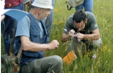
Gestion et développement du paysage